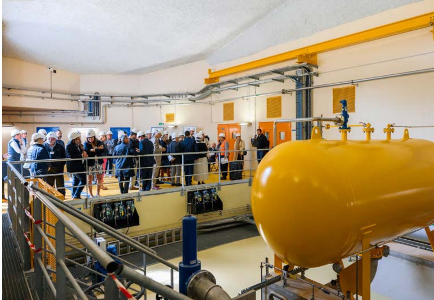
L'intérieur de la nouvelle station de pompage.

« Le SEDIF devait se montrer à la hauteur des enjeux et anticiper avec une vision prospective qui fait la force des Grands syndicats intercommunaux. En quatre ans, le site a été totalement transformé, et 20 millions d'euros y ont été investis avec une exigence de construction de haute qualité architecturale, portée par le Syndicat pour tous ses ouvrages, sans oublier le devoir de la protection de l'environnement et la mise en valeur paysagère », André Santini, président du SEDIF