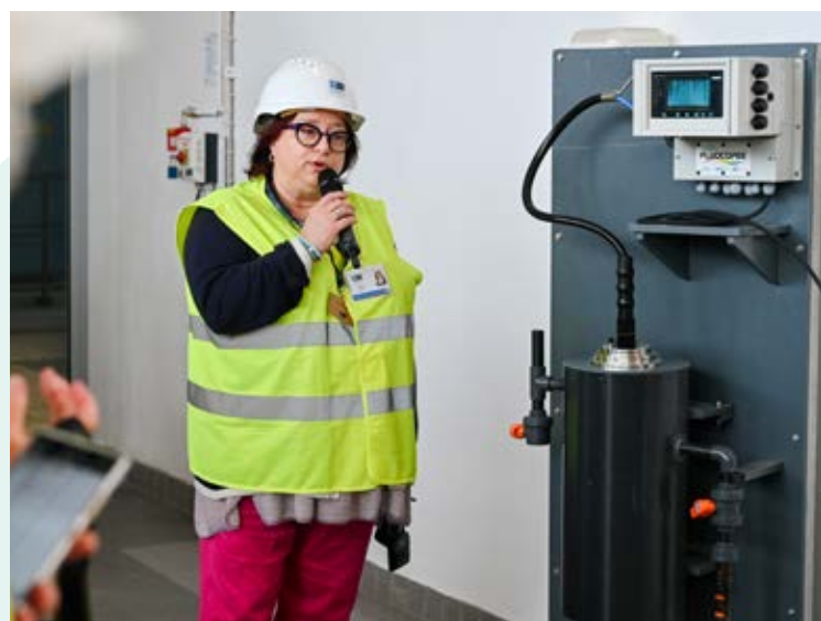
La sonde Fluocopée® a été présentée en septembre 2023 à l'usine de Choisy-le-Roi.

Installé à l'usine de Méry-sur-Oise depuis 2023, ToxMate permet le recueil et l'analyse en temps réel des modifications du comportement des organismes aquatiques et les transcrit grâce à un programme d'intelligence artificielle en un indice global de contamination. En cas de détection de pollution, l'alerte est donnée à l'exploitant de façon à adapter les traitements. ●