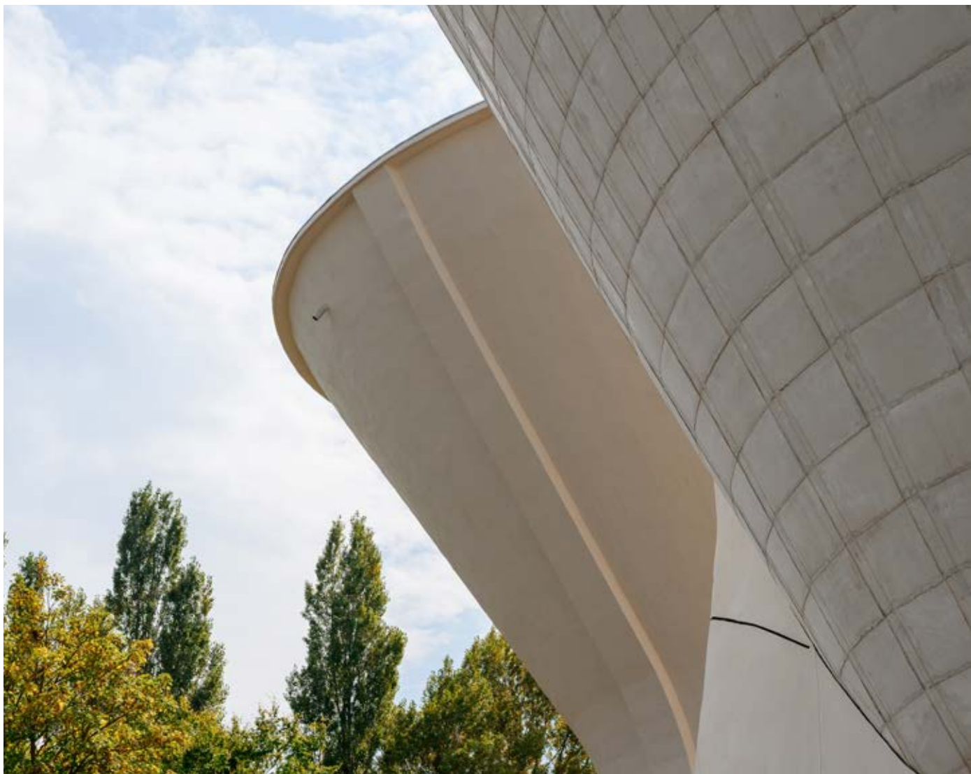
À gauche, le réservoir réhabilité, à droite, le nouveau réservoir.

été entièrement rénové : ses façades ont été désamiantées et ravalées, et l'ensemble des équipements hydrauliques et électriques ont été changés.