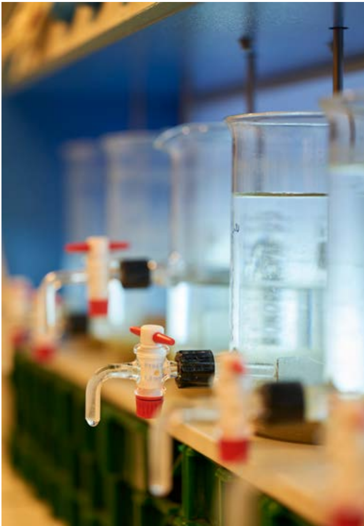
Le laboratoire d'analyses de Choisy-le-Roi.

La surveillance de la qualité de l'eau s'appuie sur deux types de contrôle : le contrôle sanitaire , défini par le Code de la Santé Publique et mené sous l'autorité de l'ARS, et la surveillance sanitaire, ou autosurveillance , effectuée directement par l'exploitant. Cette autosurveillance repose sur une analyse des risques spécifique aux installations de production et de distribution, permettant d'adapter les contrôles aux besoins particuliers des installations.