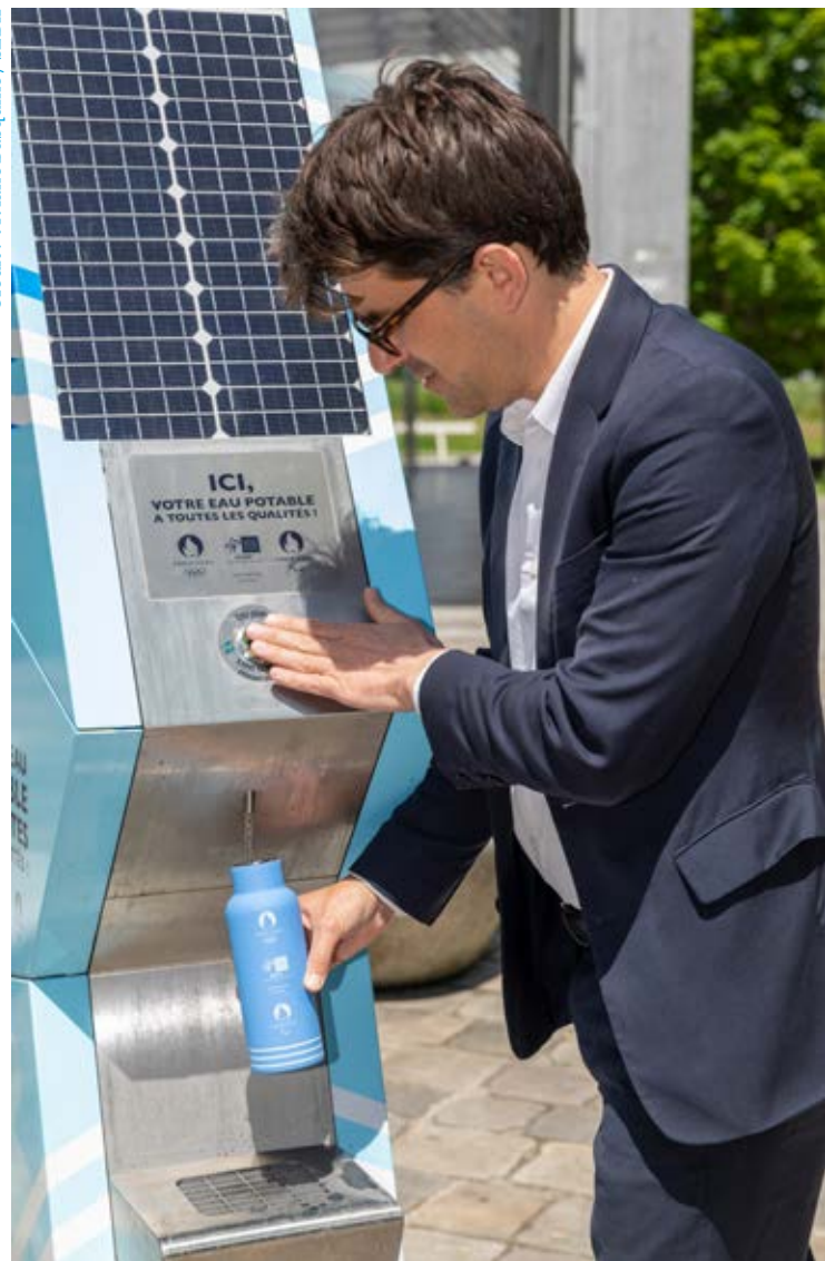
La première fontaine a été inaugurée en juin 2024 par Mathieu Hanotin, maire de Saint-Denis et vice-président du SEDIF.

de façon conforme ou qu'ils faisaient l'objet d'une surveillance particulière (en cas d'alerte ou d'incident mineur par exemple).